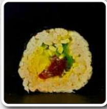
numer 33 FUTOMAKI 10szt