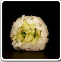
numer 8 HOSOMAKI 6szt