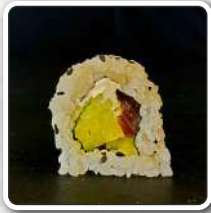
numer 35 CALIFORNIA 8szt