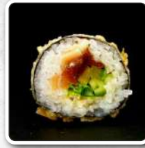
numer 34 FUTOMAKI cały w cięście tempura 10szt