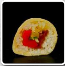
numer 36 TAMAGO 8szt